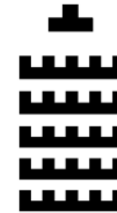
Seminar U Form